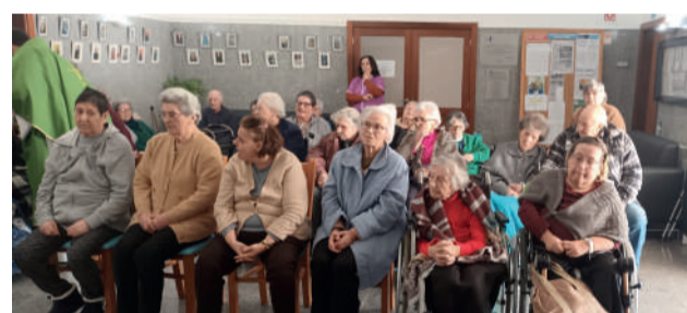
Utentes ERPI e CDIA e SAD na Celebração Eucarística