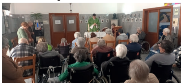
Dirigentes e Utentes na Celebração Eucarística