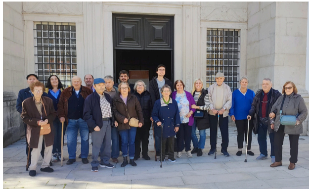
Grupo de utentes que visitaram Aveiro