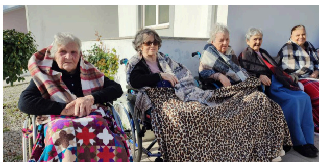
Utentes no Magusto/2025