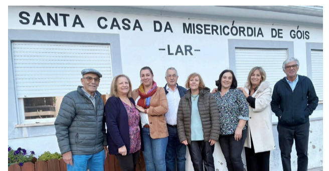
Dirigentes da SCM Góis no Tradicional Magusto de S Martinho