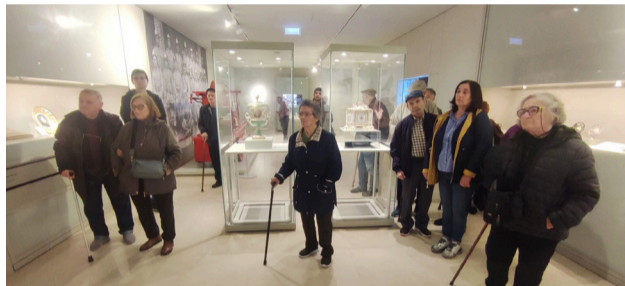
Utentes na Visita ao Museu da Vista Alegre