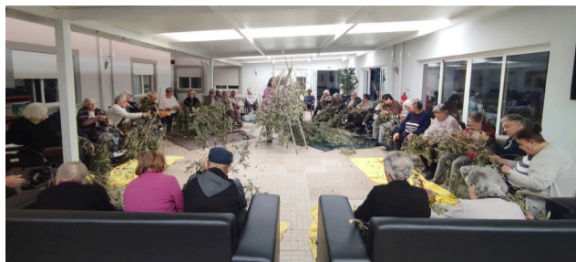
Utentes na “Apanha Azeitona”