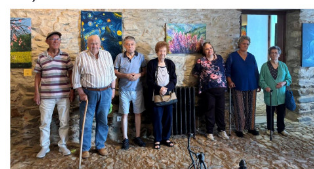
Utentes na Visita à Exposição Gois Oroso Arte 2025