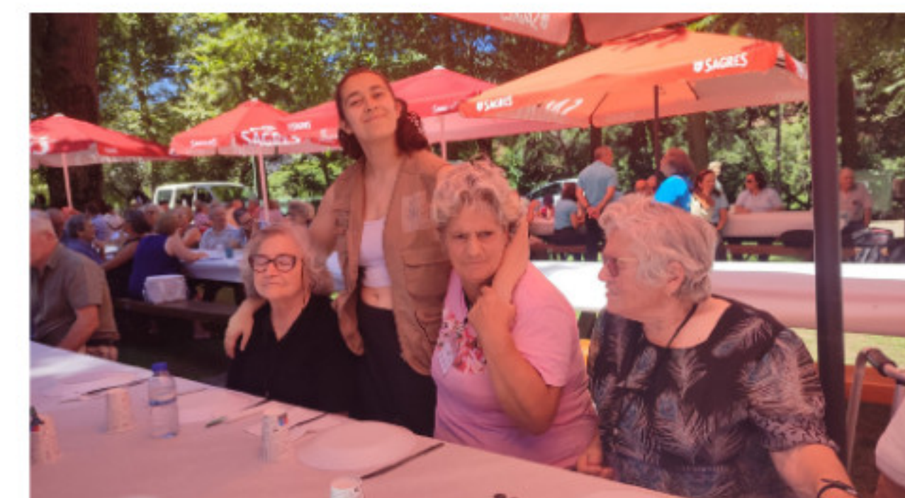
Utentes na Comemoração Dia dos Avós - Parque do cerejal