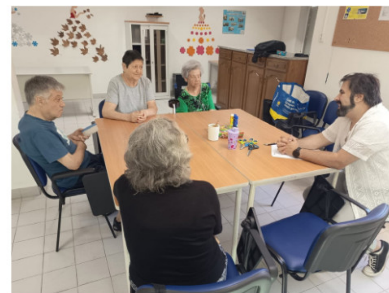
Projetos Locais Promotores de Qualificações - Formador com Utentes