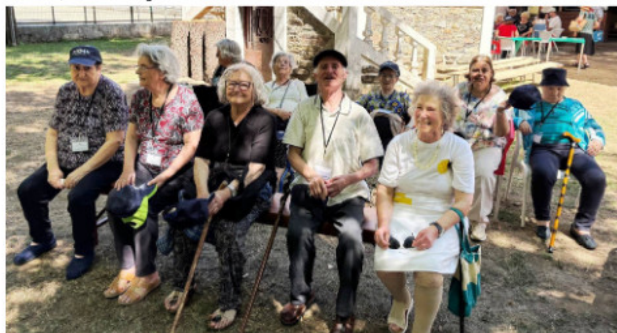
Utentes na Comemoração Dia dos Avós - Parque do Cerejal