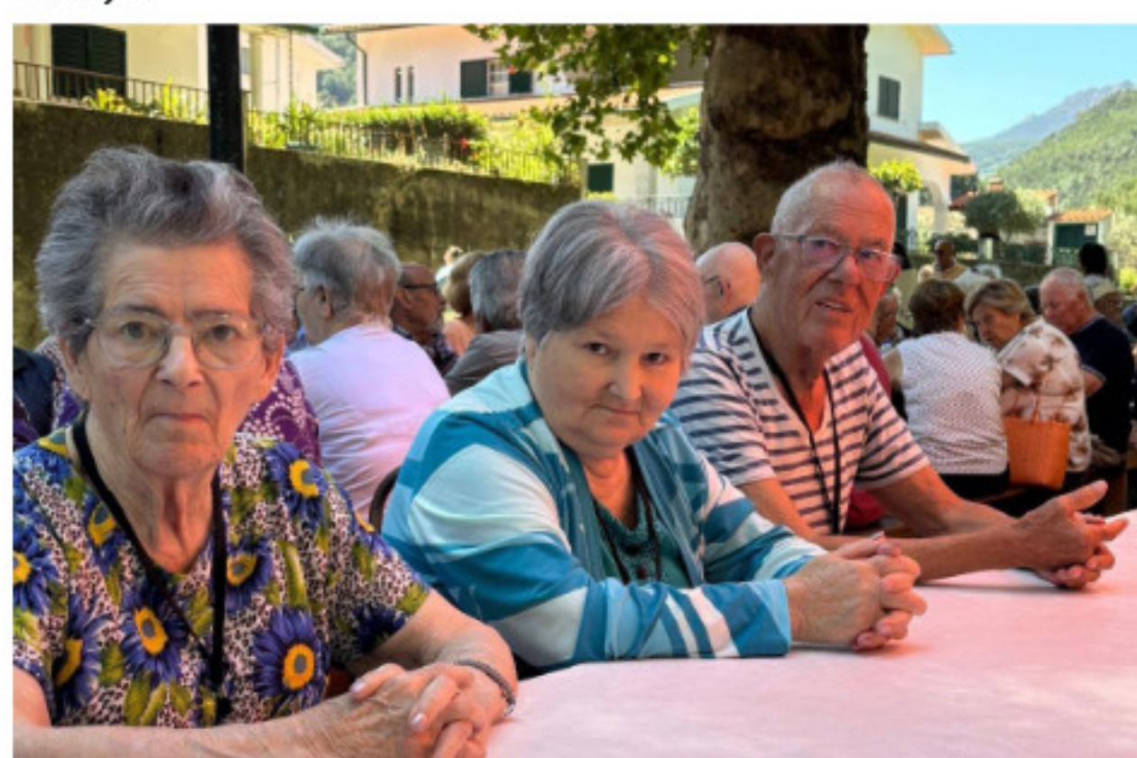
Utentes na Comemoração Dia dos Avós - Parque do cerejal