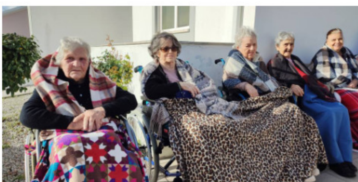
Utentes no Magusto/2025