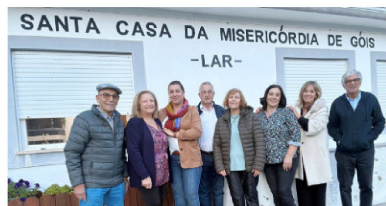
Dirigentes da SCM Góis no Tradicional Magusto de S Martinho