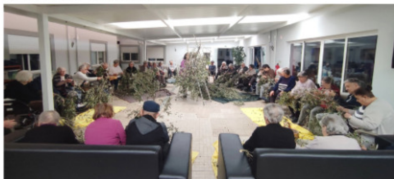
Utentes na “Apanha Azeitona”