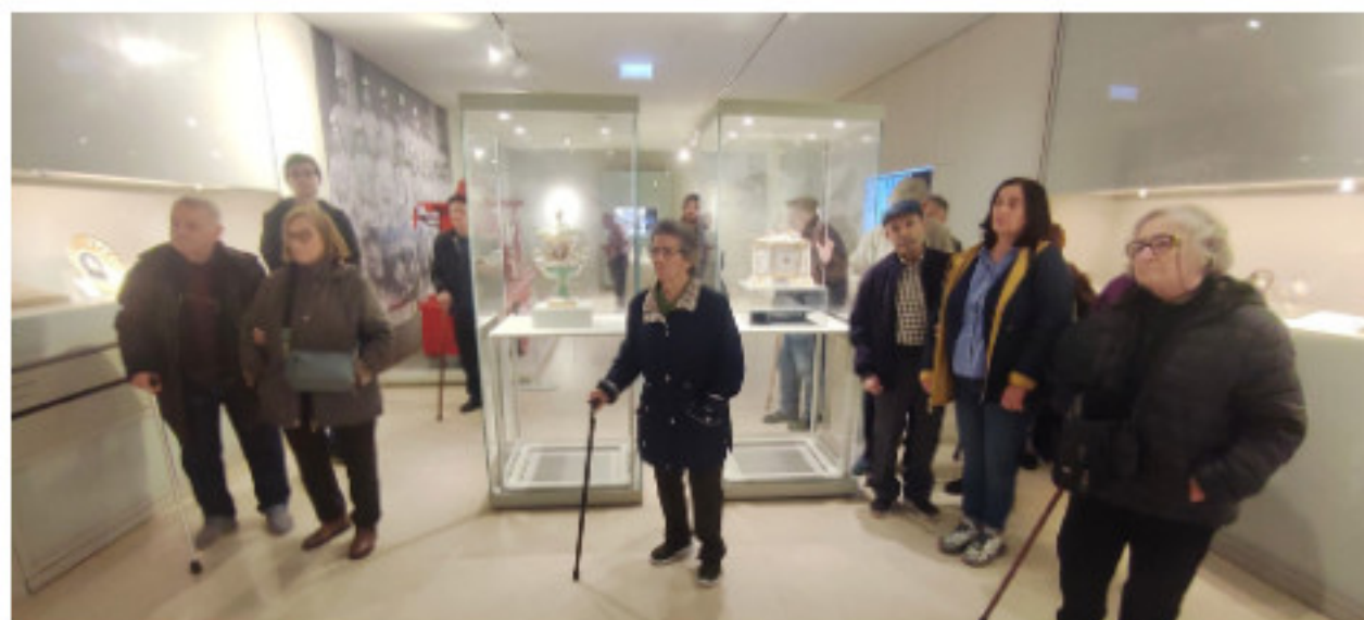
Utentes na Visita ao Museu da Vista Alegre