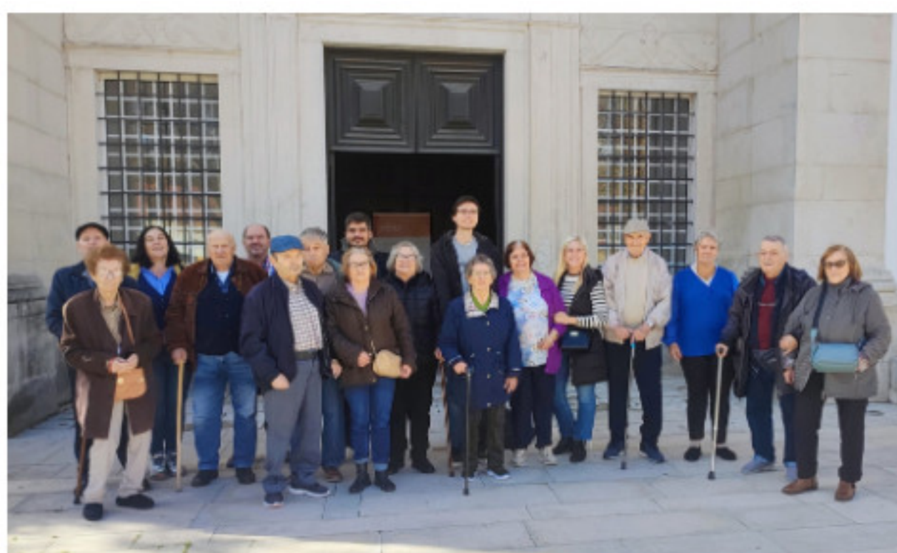
Grupo de utentes que visitaram Aveiro