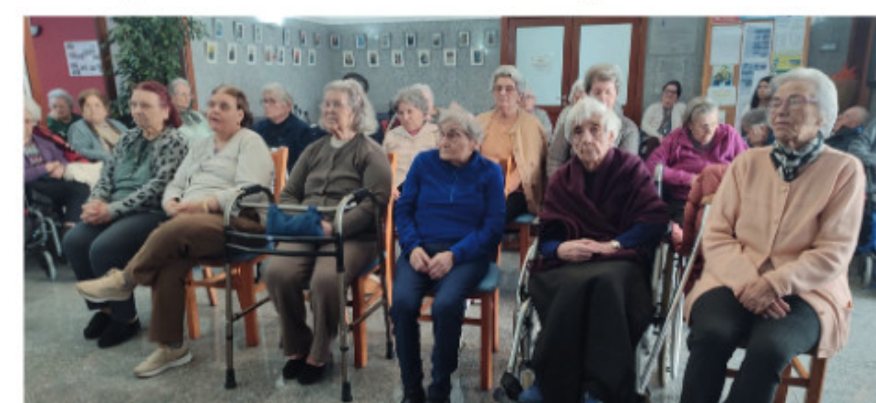
Utes na Celebração Santa Missa