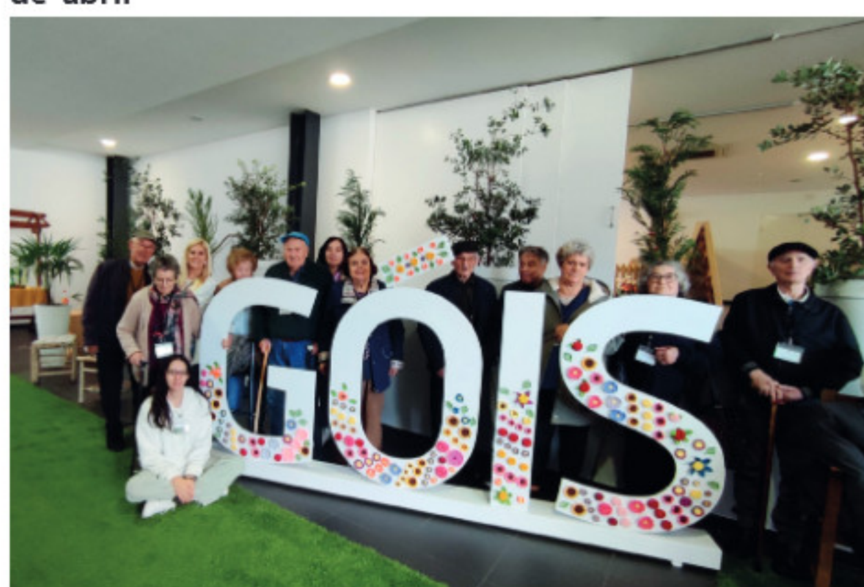
Visita à 27.ª Feira do Livro Góis