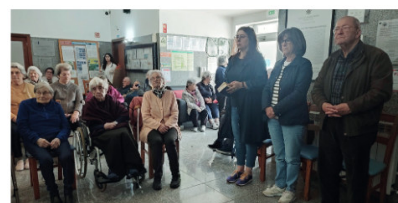
Dirigentes e Utes na Celebração Santa Missa