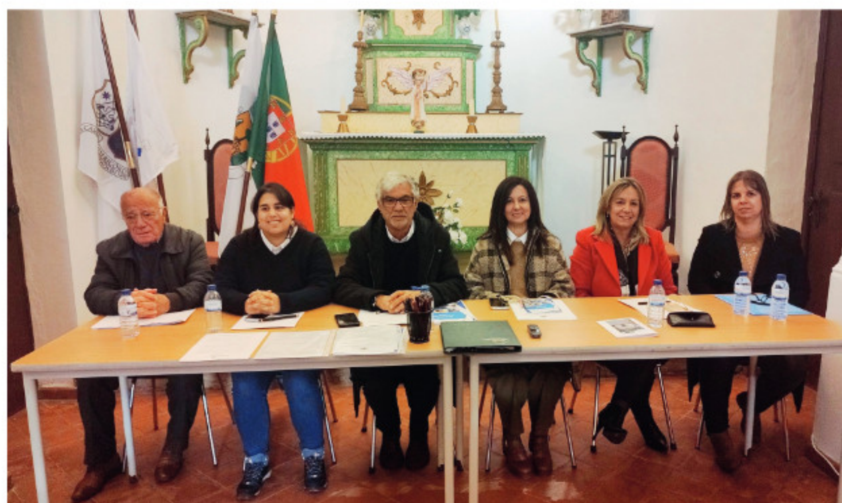
Mesa da Assembleia Geral da SCM Góis _ reunião de 15 de abril

A Santa Casa da Misericórdia de Góis reconhece e agradece o importante papel de todas as Mães, sejam elas utentes, dirigentes e colaboradoras, formulando votos de muita saúde.