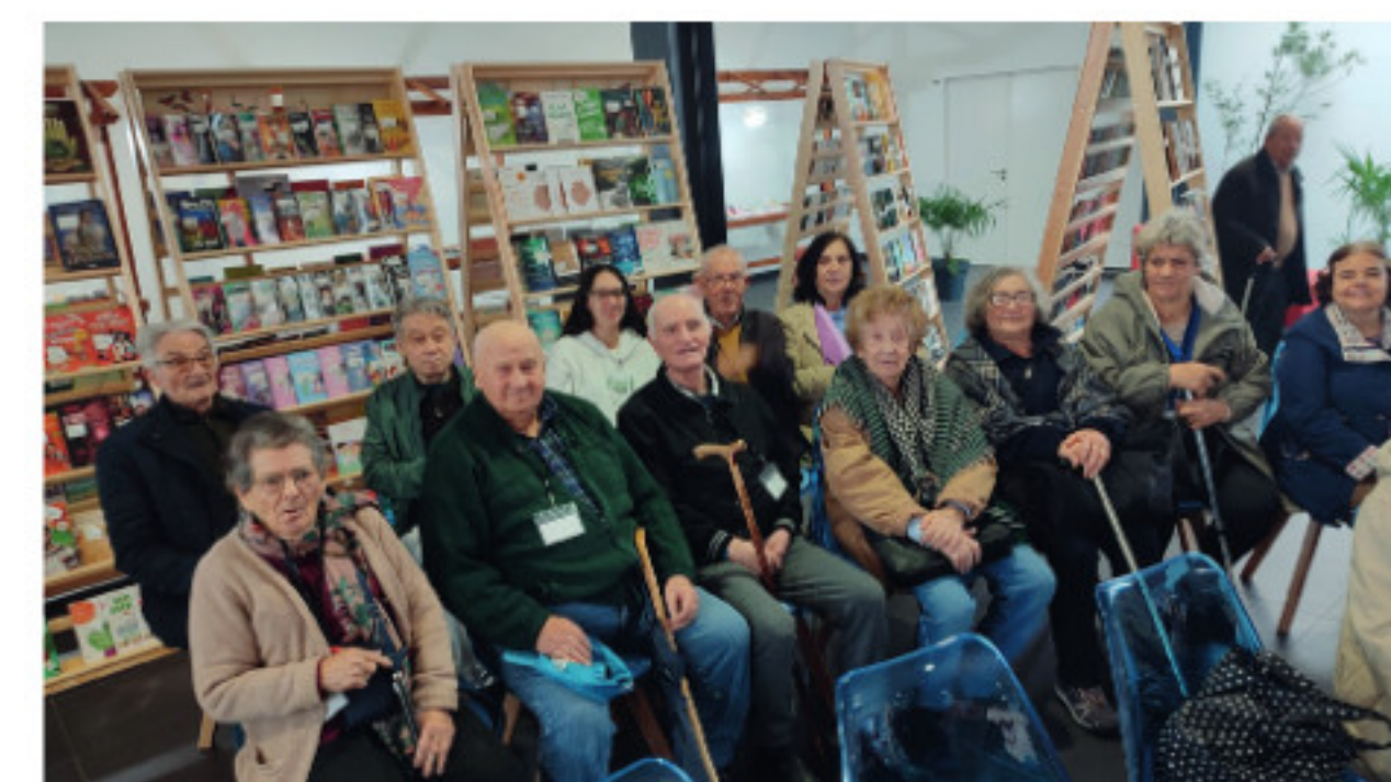
Visita à 27.ª Feira do Livro Góis