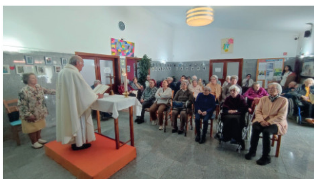
Celebração Santa Missa