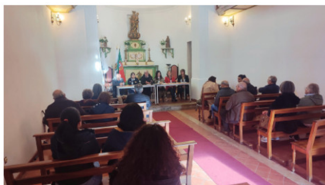
Reunião Assembleia Geral SCM Góis_ reunião de 15 de abril