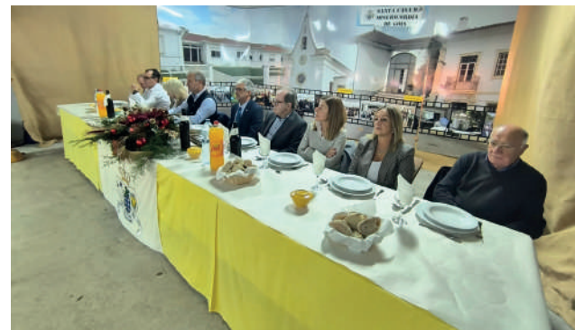
Mesa de Honra - Almoço Solidário