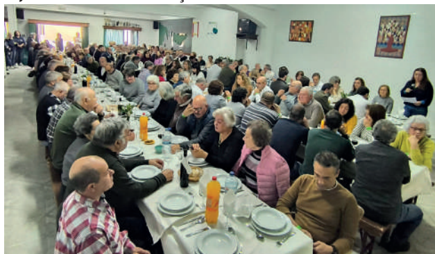
Almoço Solidário a favor da SCMG