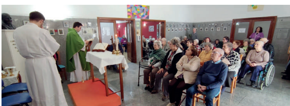
Utentes RS ERPI e CDIA na Eucaristia