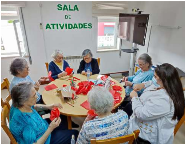
Utentes ERPI na confeção Flores para Queima das Fitas