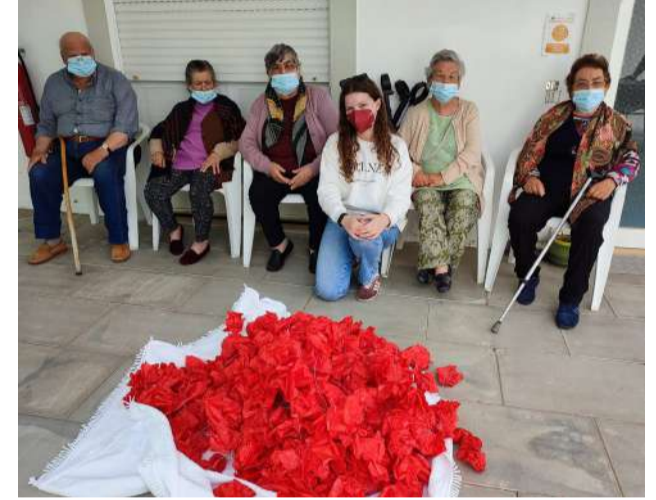
Utentes CDIA com Flores Cortejo da QFitas 22