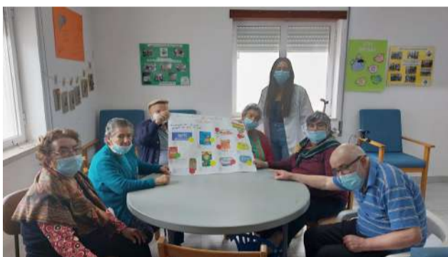
Dia Mundial da Hipertensão - Utentes CDIA