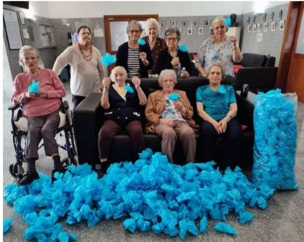
Utentes ERPI com Flores para Carro do Cortejo da QFitas22