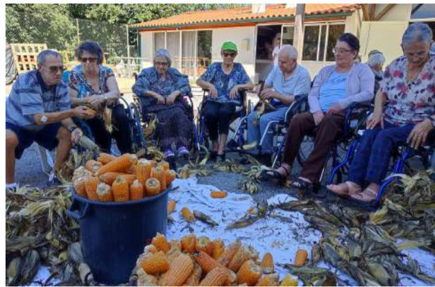
Utentes ERPI na Escapelada à Moda Antiga