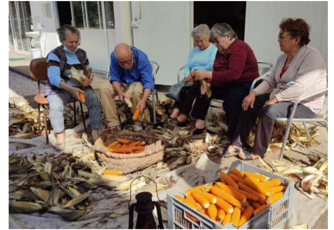
Utentes C Dia na Escapelada à Moda Antiga