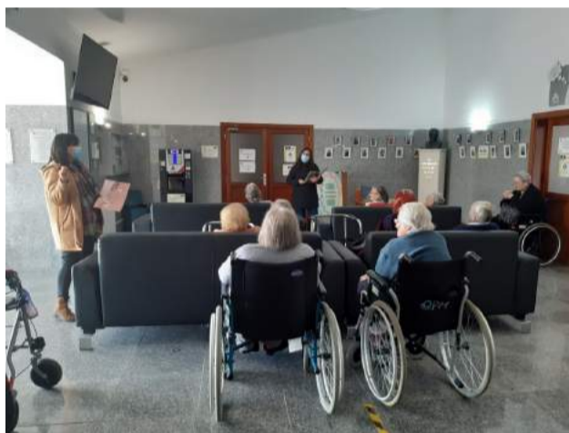
Atividade “Ecos do Passado - à conversa com...”