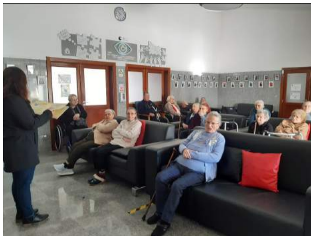
Atividade “Ecos do Passado - à conversa com...”

A doação deste equipamento por parte da Fundação Calouste Gulbenkian visou, fundamentalmente, dotar as organizações locais, (a SCM de Góis apresentou uma candidatura) de recursos que lhes permitissem continuar em frente e acreditar na sua capacidade de se reerguerem ou ajudarem a reerguer as populações a quem prestam serviços, reforçando a sua capacidade de resposta, para enfrentar futuras situações de emergência e de catástrofe semelhantes às ocorridas aquando dos incêndios florestais de Junho e Outubro de 2017.