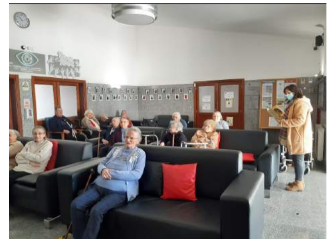
Atividade “Ecos do Passado - à conversa com...”