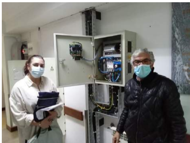
Gerador, equipamento doado pela Fundação Calouste Gulbenkian, no âmbito do Fundo de Apoio às Populações e à Revitalização das Áreas Afectadas pelos Incêndios de 2017