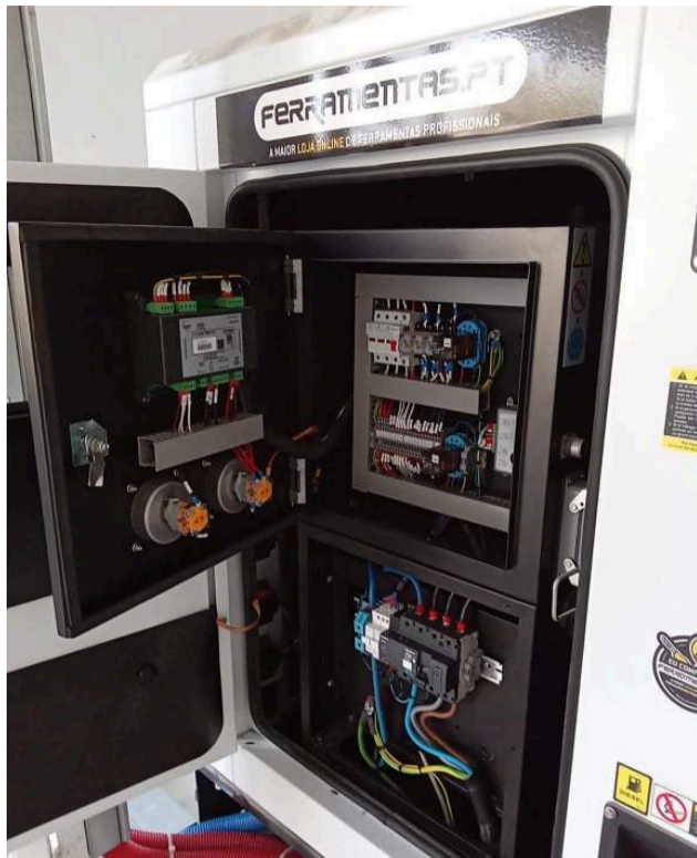
Gerador, equipamento doado pela Fundação Calouste Gulbenkian, no âmbito do Fundo de Apoio às Populações e à Revitalização das Áreas Afectadas pelos Incêndios de 2017