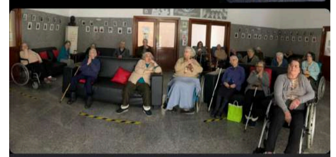
Utentes da SCM de Góis assistiram em directo à transmissão das Celebrações do 13 de Maio - Aparições de Fátima