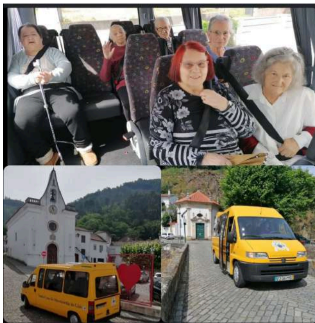
Passeio com os utentes de ERPI pelas ruas da Freguesia de Góis