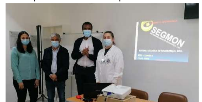
Formação em Prevenção e Gestão de Emergência em Edifícios na SCM de Góis