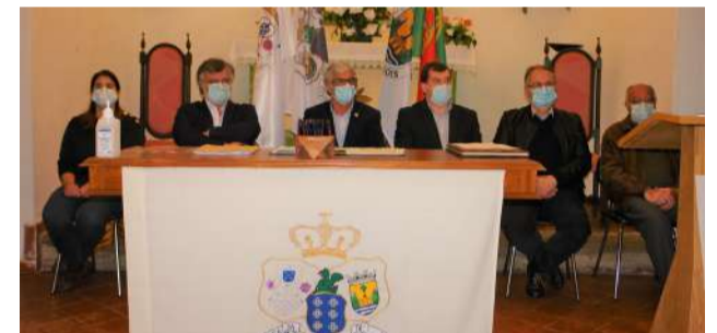
Cerimónia de assinatura do Contrato de Promessa de Compra e Venda do "Ex-Hospital Monteiro Bastos"