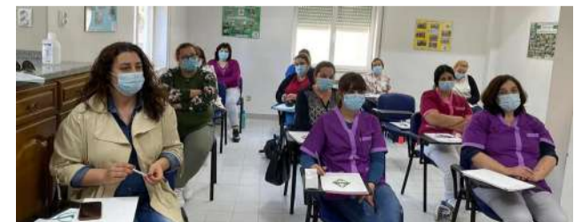
Colaboradores da SCM de Góis na Ação de Formação "Saúde da Pessoa Idosa - cuidados básicos"