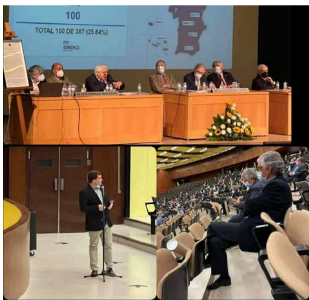
SCM de Góis na Assembleia Geral da União das Misericórdias Portuguesas