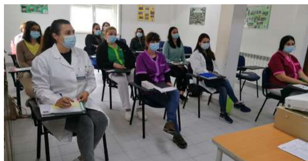
Formação promovida pela empresa SEGMON na SCM de Góis

ordinária da União das Misericórdias Portuguesas, realizada no Centro Pastoral Paulo VI, em Fátima. A Nossa Misericórdia foi uma das 100 misericórdias presentes, das 387 do País.