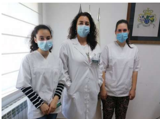
Estágios Curriculares na SCM de Góis