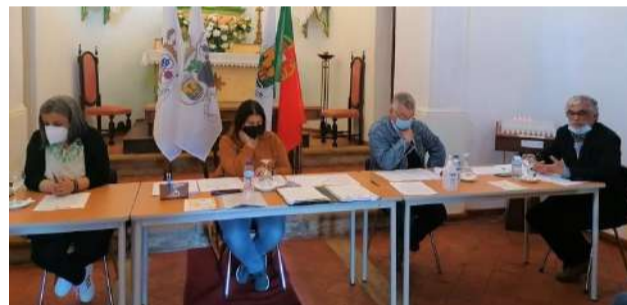
Reunião de Assembleia Geral da SCM de Góis, na Capela da Misericórdia