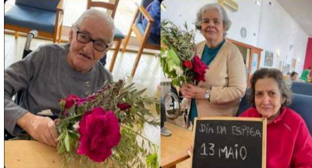
Comemoração do Dia da Espiga (Quinta-feira de Ascensão) no Lar/ERPI da SCM de Góis