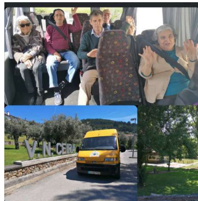
Utentes da SCM de Góis em passeio de carrinha pelas ruas da Freguesia de Vila Nova do Ceira