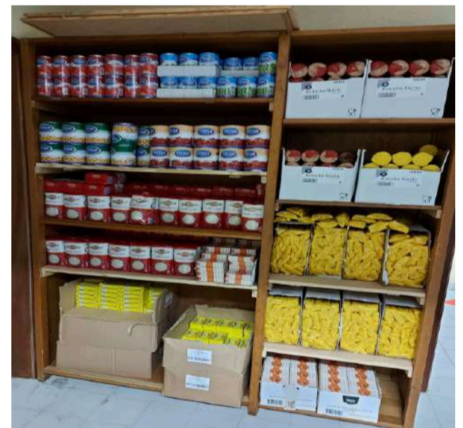
POAPMC - Programa de Ajuda Alimentar no qual a SCM de Góis é entidade mediadora no Concelho de Góis e apoia atualmente 88 pessoas carenciadas do Concelho