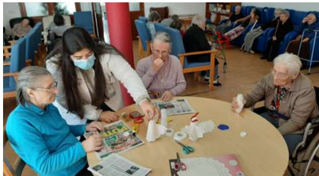
Utentes de ERPI a criarem anjos de Natal - Calendário do Advento das atividades Natalícias