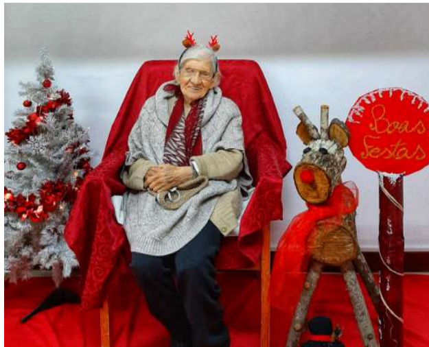
Sessão fotográfica Natalícia aos utentes de ERPI - Calendário do Advento das atividades Natalícias