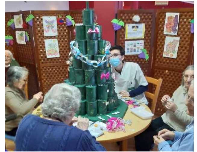
Os utentes de ERPI a construir o EcoPinheiro - Calendário do Advento das atividades Natalícias