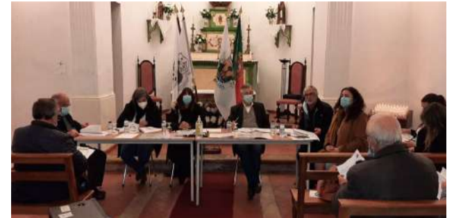
Reunião da Assembleia Geral da SCM de Góis

O Calendário do Advento inicia a sua contagem no dia 1 de dezembro até ao dia 24 de Dezembro, véspera de Natal. Para a criação do nosso Calendário do Advento de Atividades, a Dr.ª