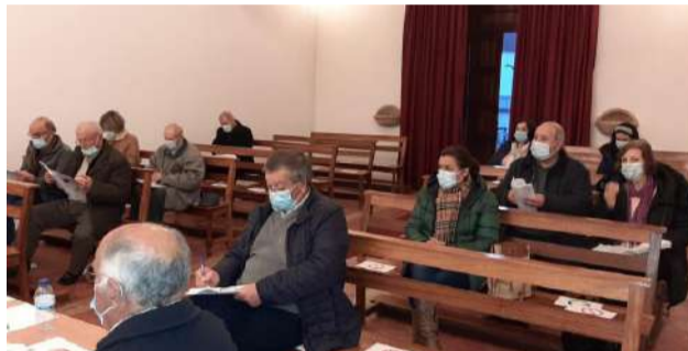
Reunião da Assembleia Geral da SCM de Góis