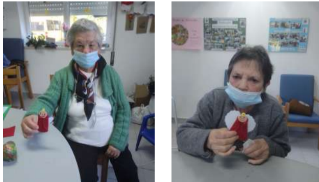
Utentes do Centro de Dia a criarem anjos de Natal - Calendário do Advento das atividades Natalícias

Qualifica da ADIP - Associação de Desenvolvimento Integrado de Poiães, entidade promotora do Curso. Procedeu-se à avaliação da aprendizagem e da formação, sendo os resultados muito positivos.