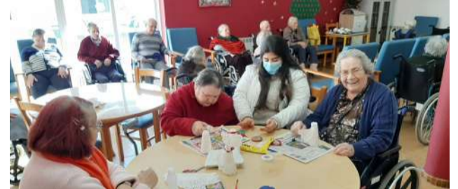
Utentes de ERPI a criarem anjos de Natal - Calendário do Advento das atividades Natalícias