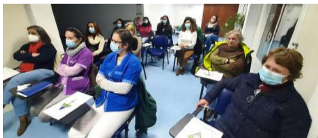
Grupo de formandas do Curso "Deontologia e Ética no apoio à comunidade"