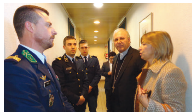
Visita ao Posto Territorial de Góis da GNR