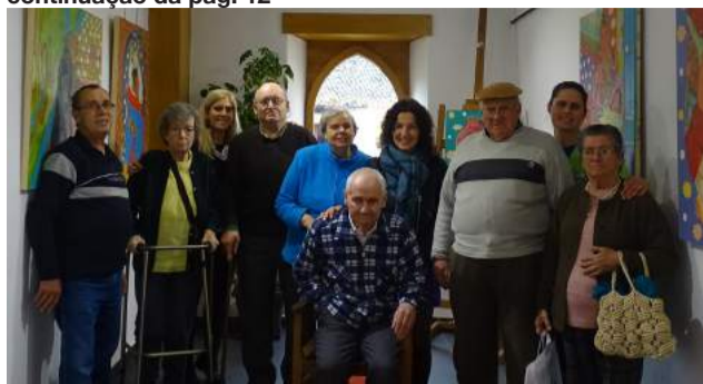
Utentes da SCMG visitam a Exposição “Crise e Transformação”