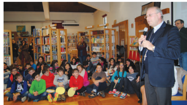
Visita ao Agrupamento de Escolas de Góis