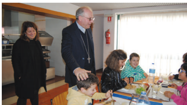
Visita à Residência de Estudantes de Góis