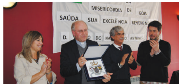
Lembrança da Santa Casa da Misericórdia de Góis para o Bispo de Coimbra

do Sr. Bispo pela redação deste jornal, bem como, a toda a comitiva que o acompanhou e que honrou O Varzeense com a sua presença.