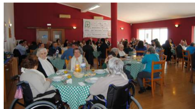
Almoço no Lar de Idosos da SCMG - Visita Pastoral