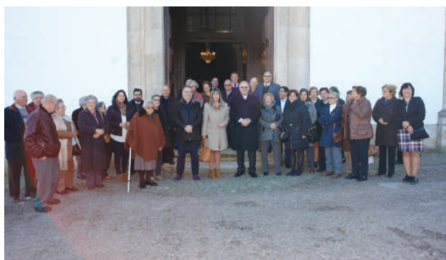
Acolhimento ao Sr. Bispo na Igreja Matriz de Góis