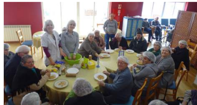
Utentes da SCMG confeccionaram um bolo, em forma de coração - Comemoração do Dia de São Valentim