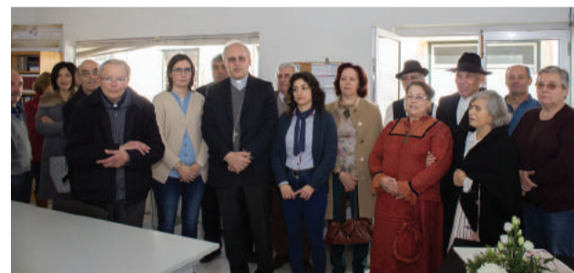
Visita ao Jornal “O Varzeense”