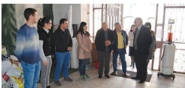
Visita à Cooperativa de Vila Nova do Ceira