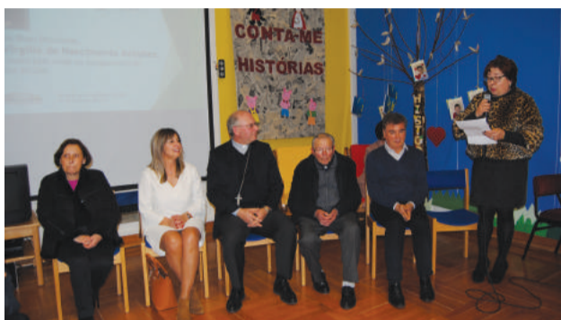
Visita ao Agrupamento de Escolas de Góis