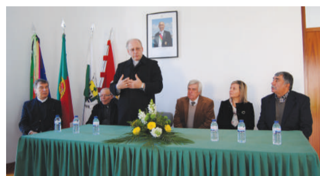
Recepção ao Sr. Bispo na Junta de Freguesia de Vila Nova do Ceira

O Jornal O Varzeense congratula-se e agradece a passagem