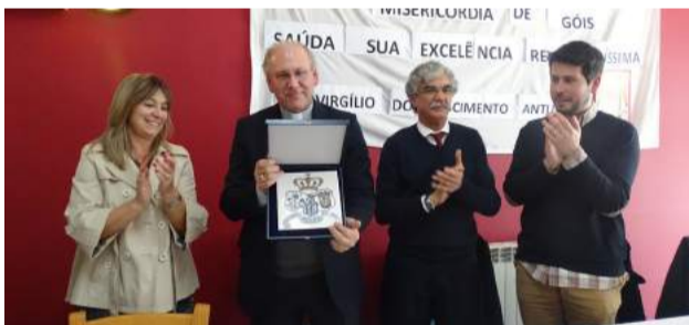
Oferta de um azulejo com o símbolo da Misericórdia a Sua Excelência Reverendíssima D. Virgílio do Nascimento