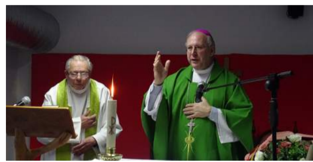
Sr. Bispo na Celebração da Eucaristia no Lar de Idosos da SCM de Góis