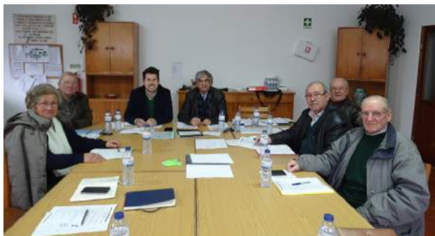
Mesa Administrativa da SCM de Góis - Reunião no Centro de Dia da Cabreira

A Mesa Administrativa da SCM de Góis agradece, reconhecendo, ao Município de Góis por mais este convite.