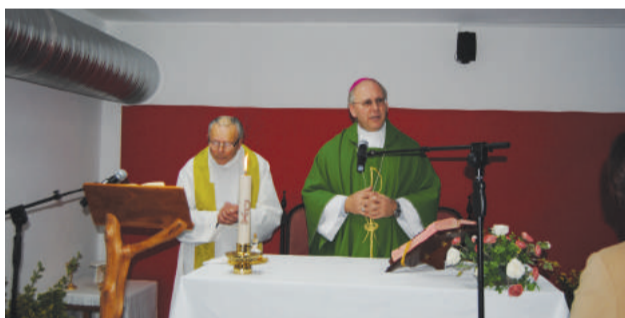
Celebração de Eucaristia no Lar da Santa Casa da Misericórdia de Góis em Vila Nova do Ceira