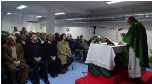
Celebração da Eucaristia no Lar de Idosos da SCM de Góis, em Vila Nova do Ceira