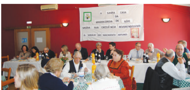
Almoço no Lar da Santa Casa da Misericórdia de Góis em Vila Nova do Ceira

“tenha condições adequadas para continuar a trabalhar a favor do desenvolvimento e do progresso”.