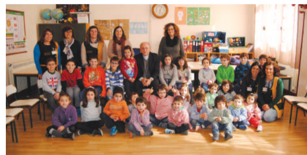
Visita à Escola de Vila Nova do Ceira