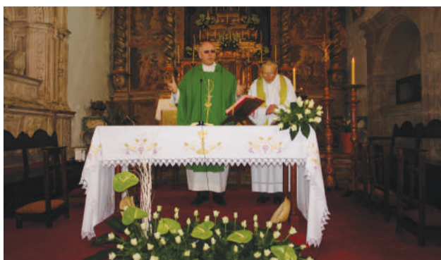
Celebração de Eucaristia na Igreja Matriz de Góis