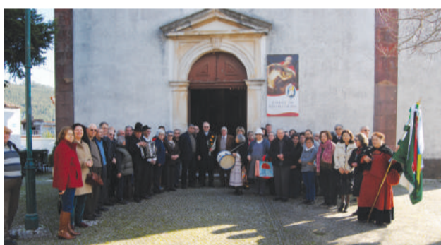
Acolhimento ao Sr. Bispo na Igreja Matriz de Vila Nova do Ceira