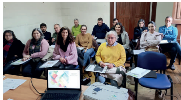
Formação Modular - Organização Pessoal e Gestão do Tempo - Grupo de Formandos

Com vista a promover uma ocupação saudável dos tempos livres dos nossos utentes, a Equipa de Animação promove sistematicamente diversas atividades que permitam em simultâneo a manutenção e melhoria das suas capacidades físicas,